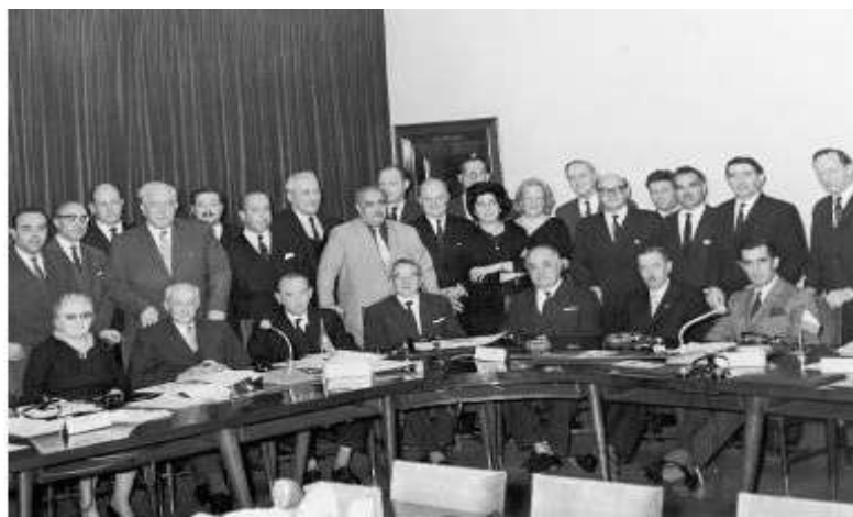
The first Organising Council - 1954